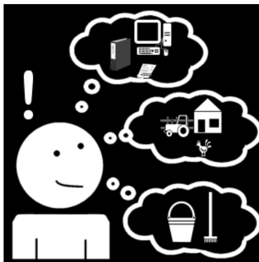
Alle spullen blijven heel